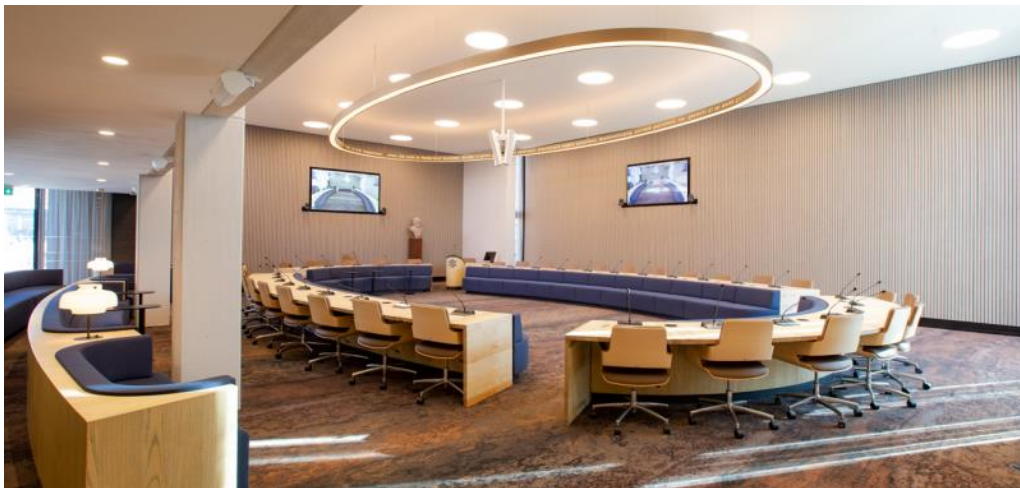
Raadzaal gemeente Dronten

Politieke partijen die bij de voorgaande verkiezing samen één kandidatenlijst hebben ingeleverd, maar bij de volgende verkiezing weer ieder met een eigen kandidatenlijst aan de verkiezing willen deelnemen, worden op één lijn gesteld met politieke partijen die voor de eerste keer aan de verkiezing deelnemen. Zij moeten dus een waarborgsom betalen en ondersteuningsverklaringen inleveren. Ook komen zij dan niet in aanmerking voor een voorkeurnummer en wordt hun lijstnummer door loting met andere nieuwe partijen bepaald.