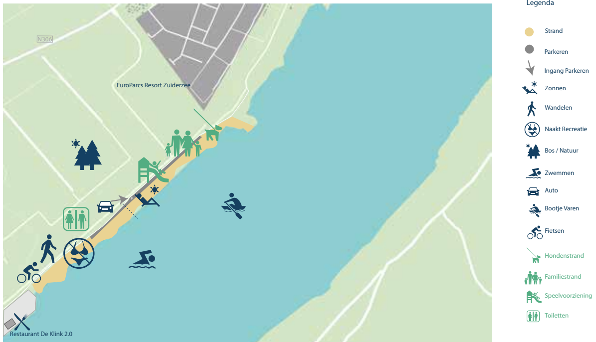
Afbeelding 13: Streefbeeld Ellerstrand-Noord

Op de grens van de twee delen zal een toiletvoorziening worden geplaatst.