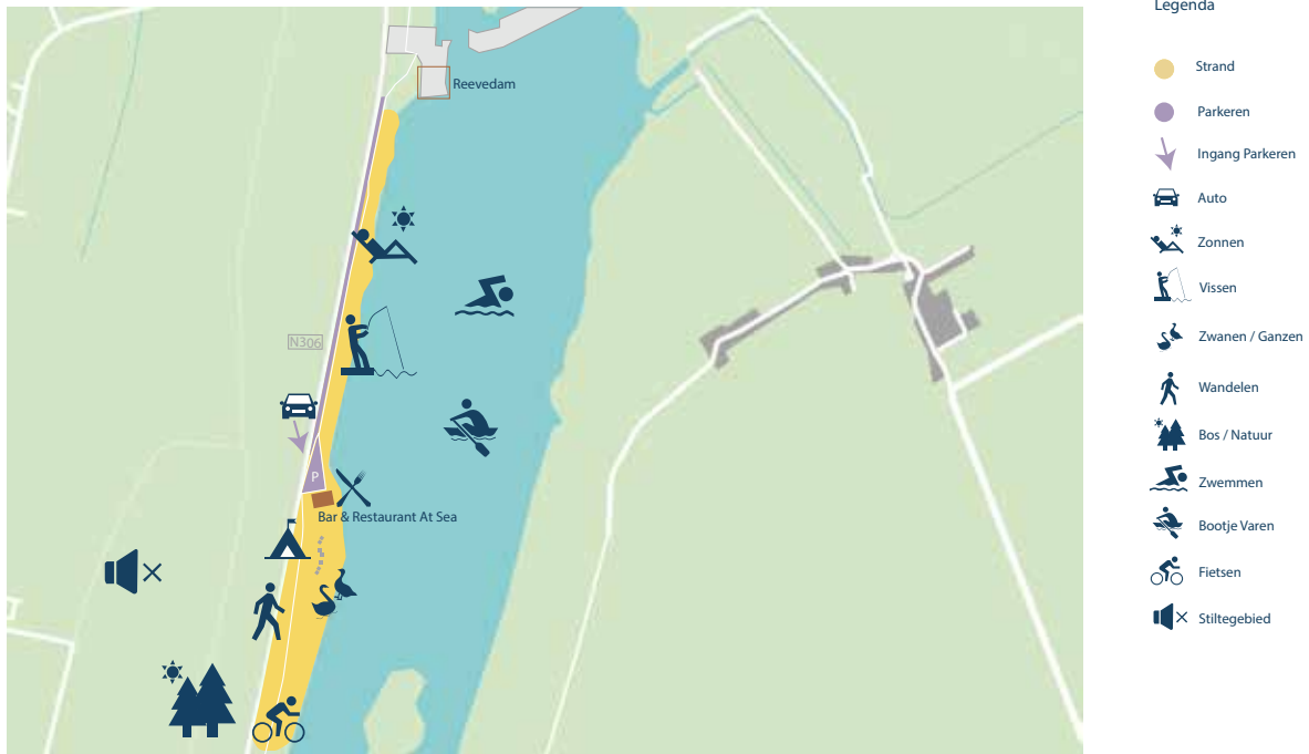
Afbeelding 2: Abbertstrand huidige situatie

Het Abbertstrand ligt aan het Drontermeer en kenmerkt zich door een combinatie van dag- en verblijfsrecreatie gescheiden door strandpaviljoen At Sea. In 2016 is er een nieuwe eigenaar in het paviljoen gekomen die het strand een kwaliteitsimpuls heeft gegeven, en is het vernieuwde strandpaviljoen At Sea geopend. Het strand wordt vooral bezocht door bezoekers uit Kampen. Op het noordelijke deel van het strand worden honden uitgelaten, wat formeel niet is toegestaan. De aanwezigheid van zwanen en ganzen wordt als probleem ervaren door met name de uitwerpselen. Op een gedeelte ten zuiden van het strandpaviljoen zijn 40 standplaatsen voor kampeermiddelen (excl. plaatsgebonden kampeermiddelen 1 ) in de periode van 1 april tot en met 31 oktober toegestaan.