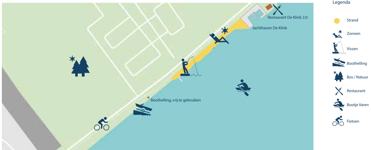
Afbeelding 5: Ellerstrand-Zuid huidige situatie

Ellerstrand-zuid is een wat natuurlijker strand vanaf restaurant De Klink 2.0 richting de natuurzone (onderdeel van Natuurnetwerk Nederland (NNN)) met afwisselend zand, gras en beplanting. Het wordt relatief weinig bezocht. Er is een vissteiger. Bij de meest zuidelijke toegang bevindt zich een botenhelling voor kleine bootjes.