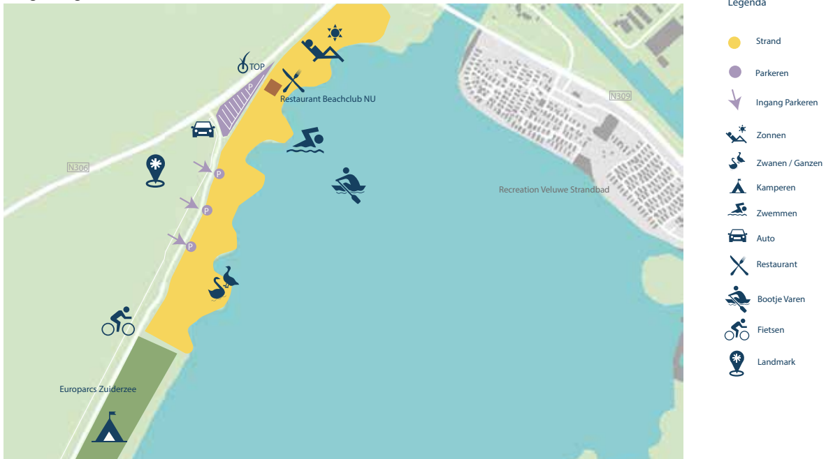
Afbeelding 3: Spijkstrand huidige situatie

Het Spijkstrand is kwalitatief één van de betere stranden en bestaat uit een mooi breed zandstrand met een aantal baaien. Het strand ligt aan het Veluwemeer en begint bij de brug naar Elburg. Vervolgens loopt het door tot de stranden bij EuroParcs Resort Zuiderzee. Op het strand is strandpaviljoen BeachclubNU gevestigd. Er zijn geen aparte toiletvoorzieningen. Wel is, nabij het Toeristisch Overstap Punt (TOP) een oplaadpunt voor de elektrische fiets aanwezig. Het Spijkstrand is één van de drukst bezochte stranden. Het is vanuit Dronten het meest dichtbij en best bereikbare strand. Het Spijkstrand wordt ook druk bezocht door fietsers en andere recreanten uit Elburg en omgeving.