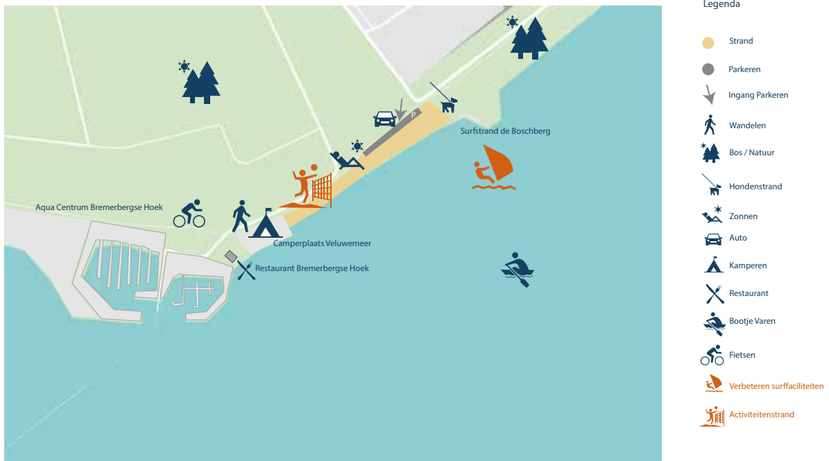
Afbeelding 15: Streefbeeld Boschbergstrand

De mogelijkheden voor vestiging van sport- en dagrecreatieve voorzieningen inclusief een gebouw blijven aanwezig. Met toevoeging van sport- en speelvoorzieningen op het strand worden jonge gezinnen getrokken naar dit strand. Dit geeft tevens de mogelijkheid om op drukke dagen als overlooplocatie voor het Bremerbaaistrand te dienen. Bezoekers worden dan doorverwezen naar het Boschbergstrand. We richten ons op de actievere strandbezoeker met gezin.