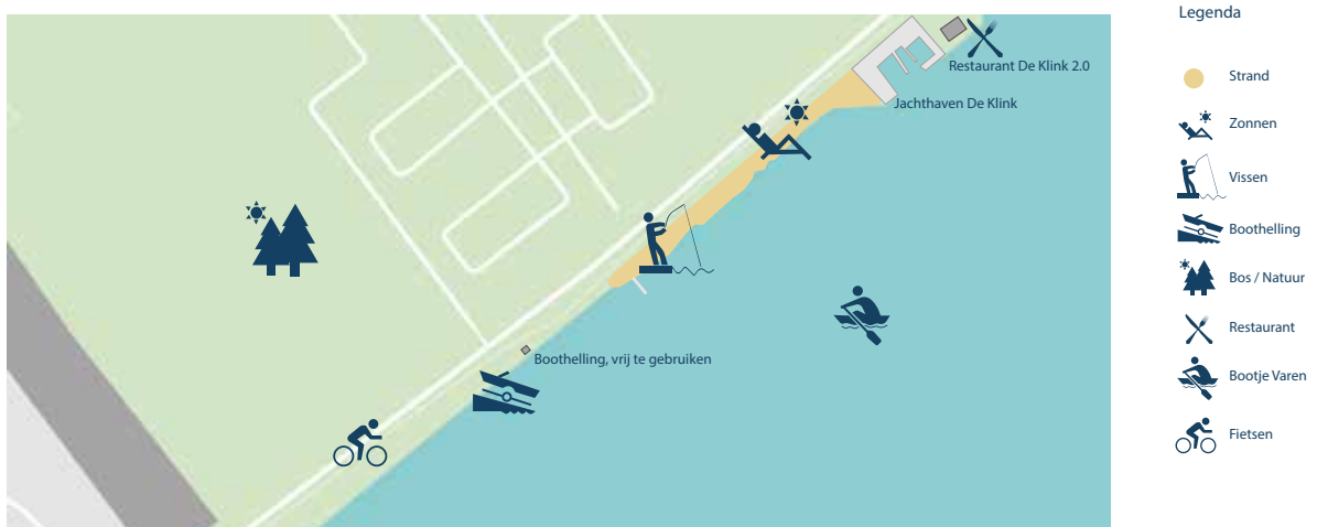
Afbeelding 14: Streefbeeld Ellerstrand-Zuid

Ten zuiden van restaurant De Klink 2.0 bevindt zich Ellerstrand Zuid. Dit deel, met botenhelling, vissteiger en natuurzone, ligt relatief verscholen. Dit strand richt zich op de rustzoeker en stijlzoeker. Het strand blijft hetzelfde van opzet.