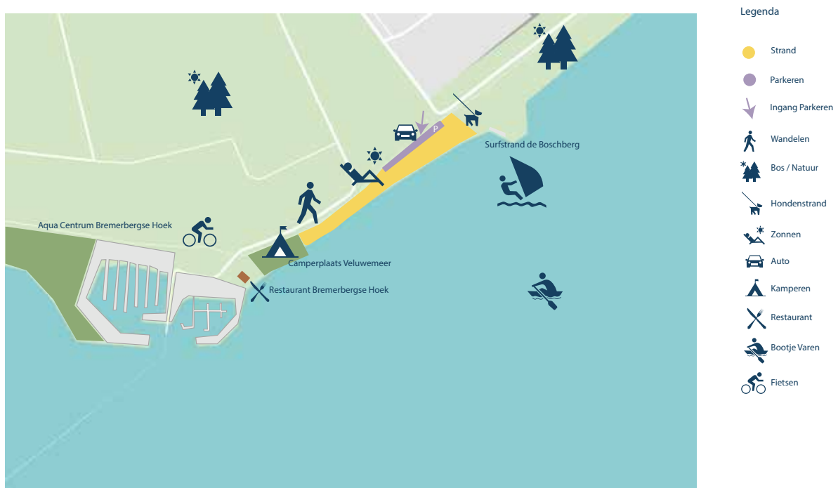
Afbeelding 6: Boschbergstrand huidige situatie

Het Boschbergstrand is een kleinschalig strandje gelegen aan het einde van de Bisselseweg tussen de natuurzone (onderdeel van Natuurnetwerk Nederland (NNN)) en Aquacentrum Bremerbergse Hoek. Op dit strandje komen bijzondere bijensoorten voor, deze zorgen voor een hoge natuurwaarde. Het wordt gebruikt door campinggasten, inwoners van Biddinghuizen en Dronten en door bewoners en bezoekers van de bungalowparken De Boschberg en De Bremerberg. Het surfstrandje met ligweides is openbaar. Jarenlang heeft hier een surfschool gezeten. Sinds het strand bij Bremerbaai is geopend, komen op het Boschbergstrand nauwelijks nog bezoekers. Op de bodem van het water langs het strand zijn relatief veel slib en waterplanten aanwezig. Bezoekers geven aan dit niet prettig te vinden.