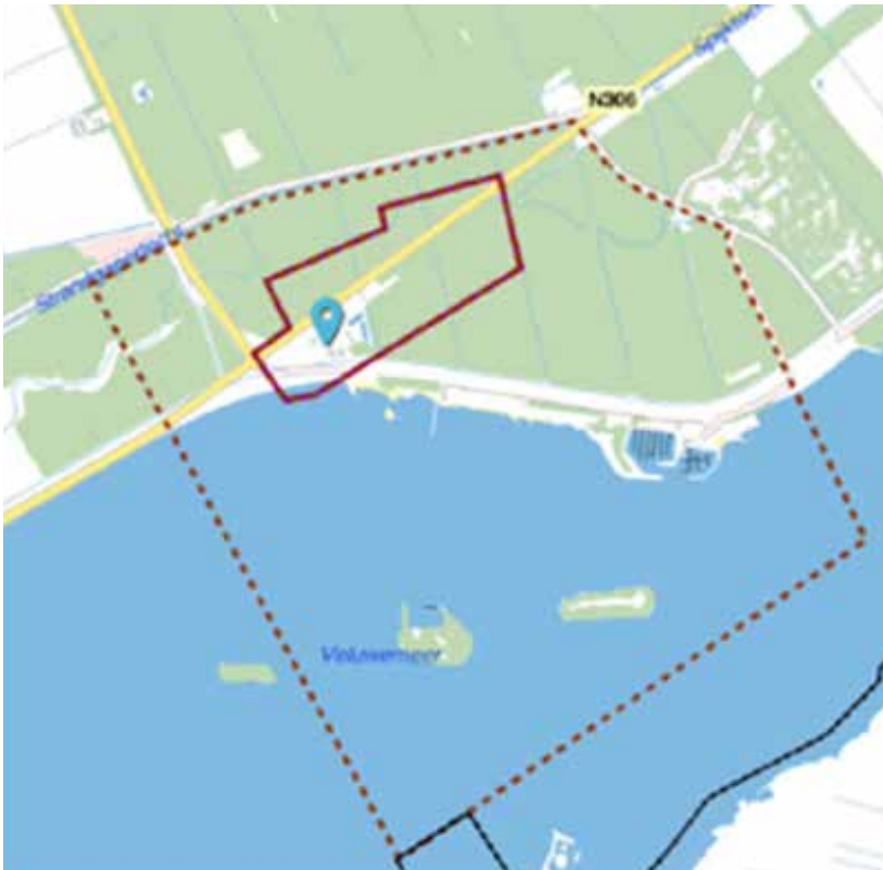
Afbeelding 10: Uitsnede waterwingebied, Omgevingsverordening provincie Flevoland