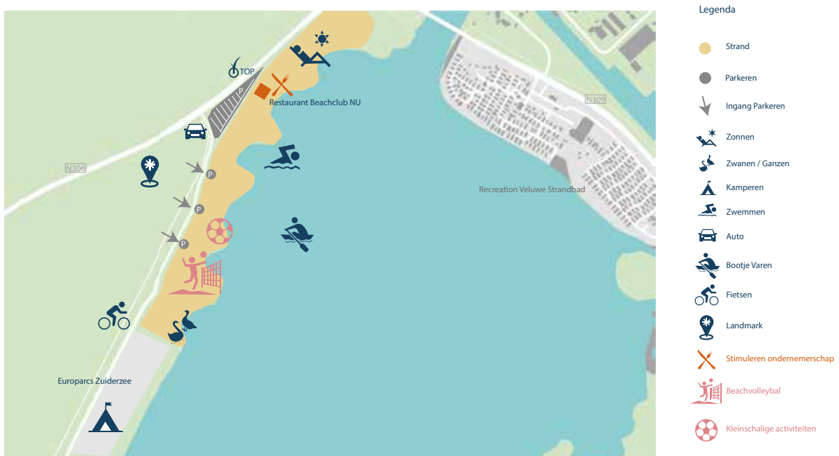
Afbeelding 12: Streefbeeld Spijkstrand

Het Spijkstrand richt zich op de plezier- en avontuurzoeker. De aanwezigheid van BeachclubNU is van meerwaarde voor de beleving op het strand. Ze zijn als het ware de gastheer op het strand. Met nieuwe voorzieningen als een badminton-, volleybalnet en speeltoestellen binden we de actievere jongere bezoeker. BeachclubNU krijgt de ruimte om kleinschalige evenementen te organiseren gericht op het gebruik van het strand. Met deze toevoegingen en mogelijkheden vormt het Spijkstrand één van de hotspots. Op het strand zal een toiletvoorziening worden geplaatst. De aanwezigheid van het naastgelegen kunstwerk Riff kan een aanzuigende werking hebben. Dit zal met name gemerkt worden op het parkeerterrein.