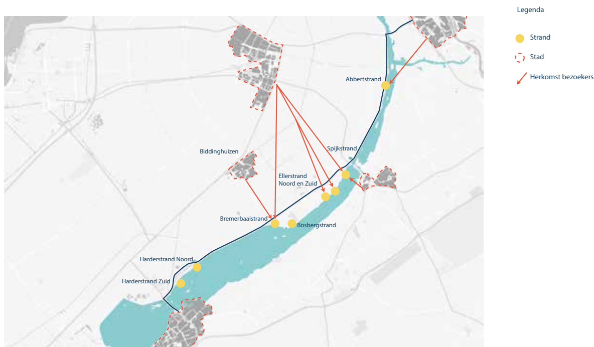
Afbeelding 1: Huidige situatie

De gemeente Dronten heeft 60 km aan kustlijn, waaronder acht stranden, natuurterreinen en recreatieterreinen. Hieronder zijn de grootste (herkomst)stromen van bezoekers aangegeven. Tevens geeft de afbeelding weer wat het plangebied is: de stranden. De stranden worden afgewisseld met voorlanden.