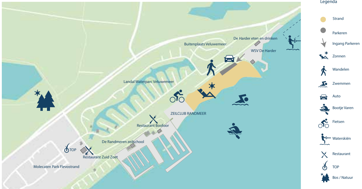
Afbeelding 8: Harderstrand-Noord huidige situatie

Harderstrand-noord is gelegen in de zuidelijke punt van onze gemeentegrens aan het Veluwemeer ten noorden van Molecaten Park Flevostrand en naast het terrein van Waterskivereniging De Harder. Het is een rustig zandstrand en wordt momenteel bezocht door bewoners en bezoekers van appartementencomplex Zuiderzee op Zuid, recreanten van Molecaten Park Flevostrand en Landal Waterparc Veluwemeer. Het fungeert als een soort uitlooph gebied achter hun verblijfsaccommodatie. Bij de receptie van Molecaten Park Flevostrand, nabij het Toeristisch Overstap Punt (TOP), is een oplaadpunt voor de elektrische fiets aanwezig.