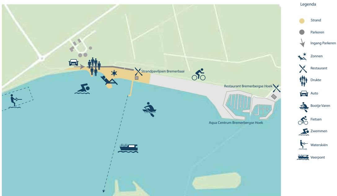
Afbeelding 16: Streefbeeld Bremerbaaistrand

Dit strand is net aangelegd. Zowel het strandpaviljoen als de naastgelegen Aquacentrum Bremerbergse Hoek richten zich op de rustzoeker en harmoniezoeker. De voorzieningen voldoen aan de nieuwste standaarden. Het toevoegen van extra parkeerplaatsen is door ruimtegebrek en het naastgelegen waterwingebied niet te realiseren. De laatste jaren is gebleken dat het strand sneller afkalft dan gepland. Hiervoor is extra onderzoek nodig.