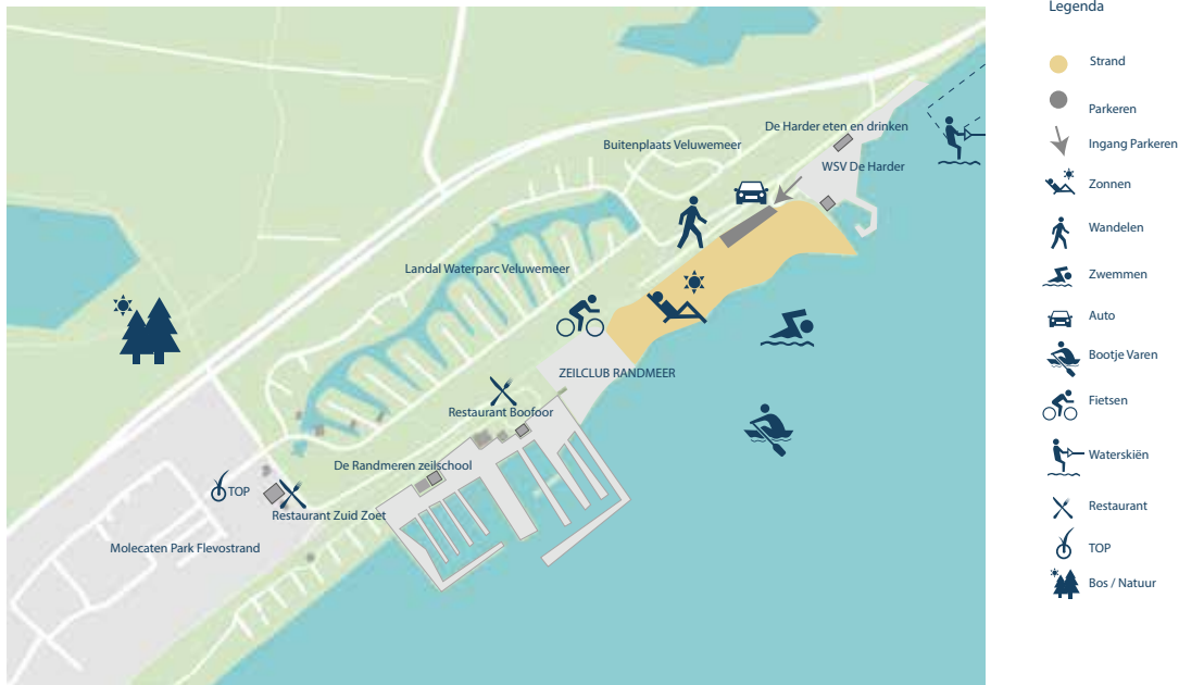
Afbeelding 17: Streefbeeld Harderstrand Noord

Het Harderstrand Noord richt zich op de rustzoeker en de stijlzoeker. De openbaarheid blijft behouden. Om het karakter van het strand te behouden worden hier geen fysieke wijzigingen door gevoerd. In overleg met Molecaten en omwonenden wordt onderzocht of en welke activiteiten op het strand kunnen plaatsvinden.