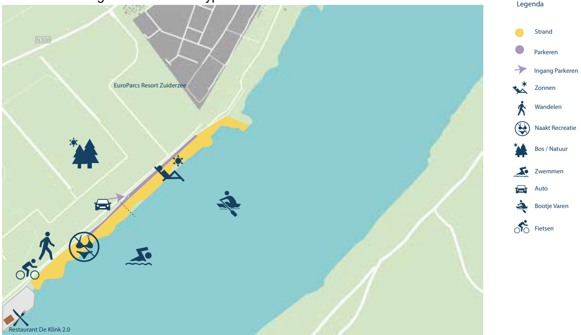
Afbeelding 4: Ellerstrand-Noord huidige situatie

Ellerstrand-Noord ligt aan het Veluwemeer tussen EuroParcs Resort Zuiderzee en restaurant De Klink 2.0 ter hoogte van een toekomstig recreatiepark op het Ellerveld. Het is een zeer uitgestrekt strand met een aantal baaien en afwisselend zand- en grasstrandjes. Door de ruime opzet is het een wat rustiger en extensiever gebruikt strand. Het zuidelijk deel hiervan is bedoeld voor naturalisten en heeft landelijke bekendheid. De relatief verscholen ligging van dit deel van het strand geeft een geborgen gevoel voor de naaktrecreant, maar geeft tegelijkertijd soms een gevoel van onveiligheid door de aanwezigheid van andere typen recreanten.