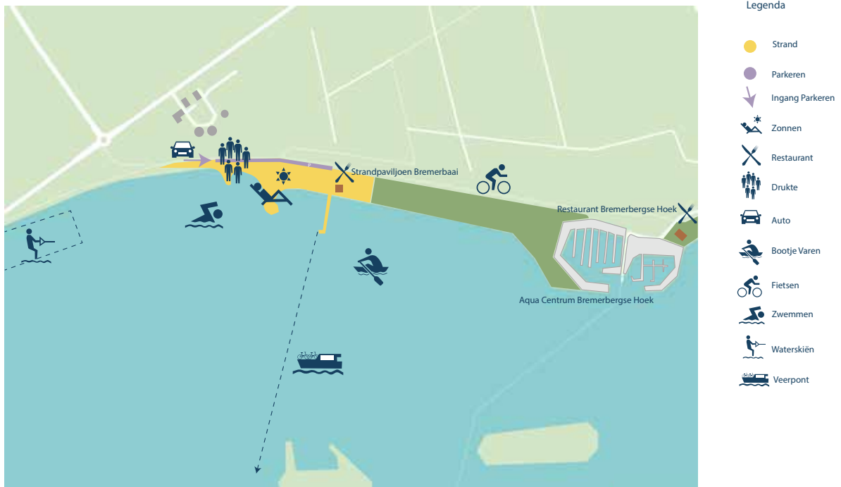
Afbeelding 7: Bremerbaaistrand huidige situatie

Dit is het jongste strand. Het is aangelegd ten zuiden van Aquacentrum Bremerbergse Hoek in 2016 met veilige ondiepe zwembaaieren en een speeleilandje. Tevens is er een lange aanlegsteiger met uitkijkpunt. Het strandpaviljoen De Bremerbaai is geopend sinds 2016. Vanaf de aanlegsteiger vaart in het seizoen een fietspont naar Nunspeet voor € 4,- p.p. Vanaf 2020 wordt een tweede fietspont in de vaart genomen. Ook hier zijn nabij het Toeristisch Overstap Punt (TOP) oplaadpunten voor de elektrische fiets aanwezig. Het Bremerbaaistrand wordt als zeer positief ervaren. Het is een mooi en goed onderhouden strand. Het (betaald) parkeren is hier modern en goed geregeld, maar door de populariteit van het strand is deze voorziening snel vol. Dit leidt op mooie zomerse dagen tot wild parkeren in de berm langs de Bremerbergweg en de Harderdijk wat zo nu en dan tot gevaarlijke situaties leidt.