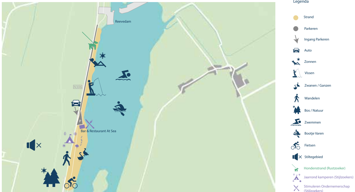
Afbeelding 11: Streefbeeld Abberstrand

De toiletvoorzieningen zijn aan vervanging toe.